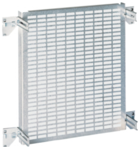
Panou montaj perforat 500x450mm (LxH)