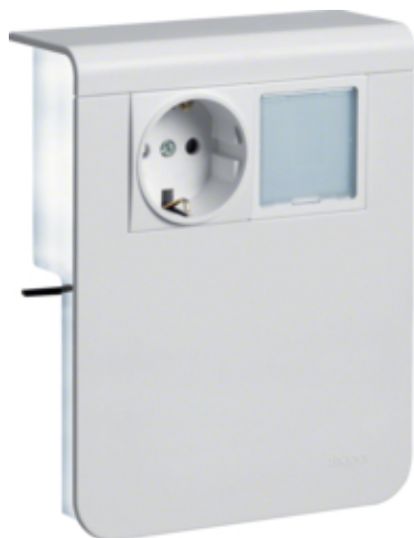
Priza SCHUKO LED SL20115, RAL9010