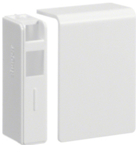
Placa de capat SL20055, RAL9010