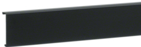
Capac SL20080, RAL9011