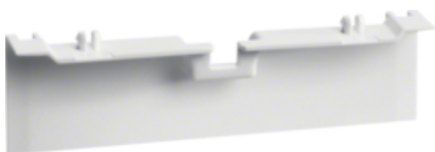
Capac SL20080, RAL9010