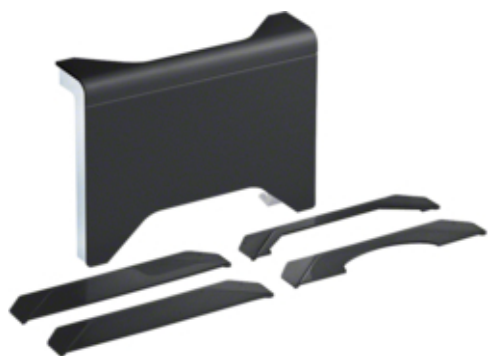
Derivatie T 3D, SL20115, RAL9011