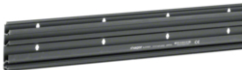
Soclu plinta SL20080, RAL9011