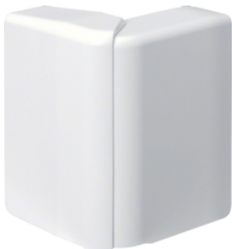
Cot exterior SL20080, RAL9010