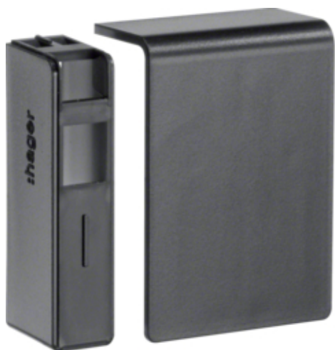
Placa de capat SL20055, RAL9011