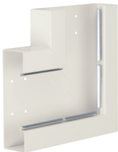
Cot plan BRS65210B, otel, RAL9001