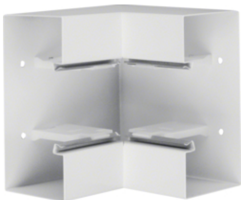
Cot interior BRS85170, otel, RAL9010