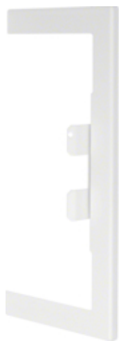
Masca perete BRS100210B, oțel, RAL9010