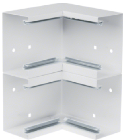
Cot interior BRS65210D, oțel, RAL9010