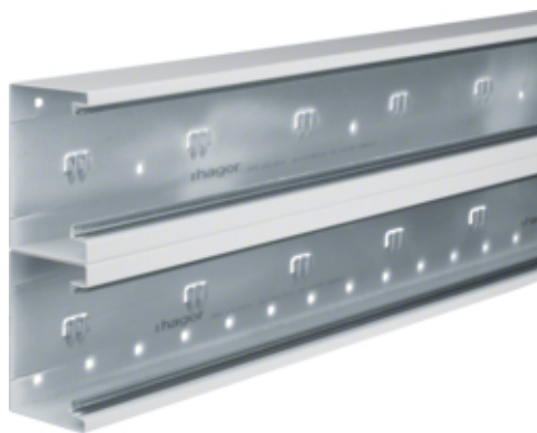
Canal cablu BRS65210D, oțel, RAL9010