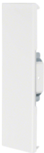
Placa închidere BRS65210, oțel, RAL9001