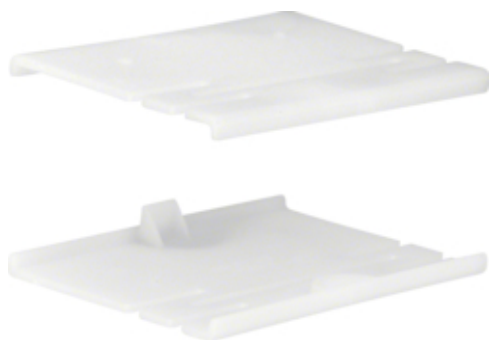
Set cuplare BR70100