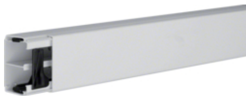
Canal cablu LF 40061, RAL7035