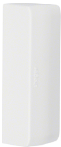
Capac plinta 20x75, RAL9010