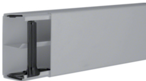
Canal cablu LF 60111, RAL7030