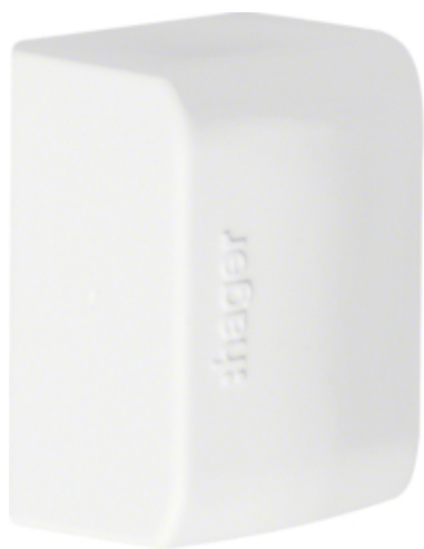
Placa de capat 16x30, RAL9010