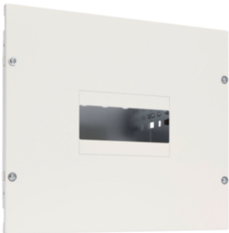
Kit MCCB 250A L350mm vertical