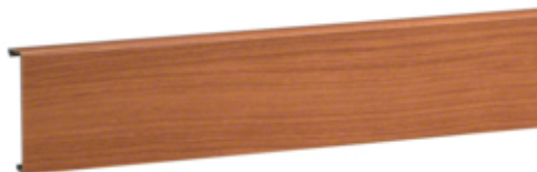
Capac SL20080, cires