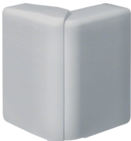
Cot exterior SL20080, aluminiu