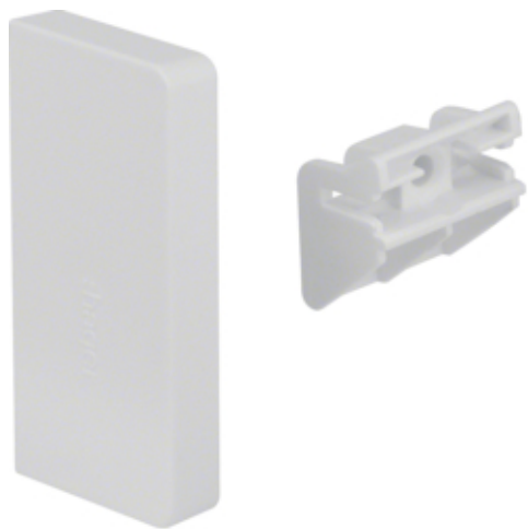
Piesa capat SL20x55 mm, RAL9010