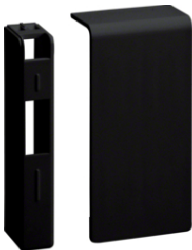
Placa de capat SL20080, RAL9011