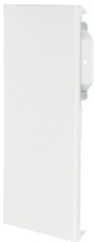
Placa închidere BRS100210D, oțel, RAL9010