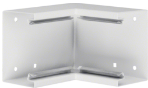
Cot interior BRS65100, otel, RAL9010