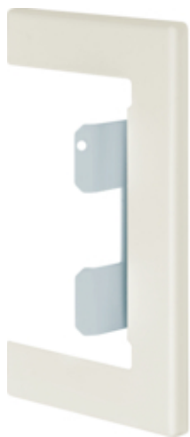
Masca perete BRS65100, oțel, RAL9001