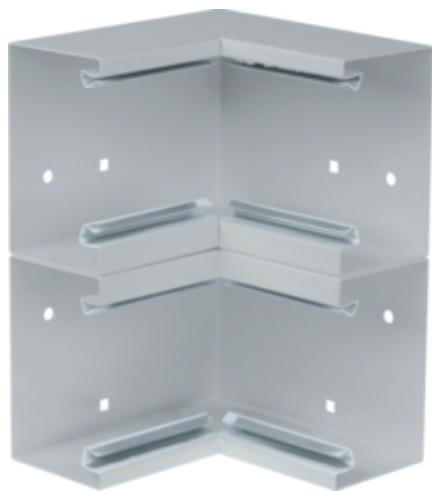
Cot interior BRS65210D, oțel, galvanizat