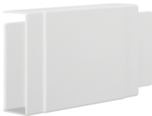
Derivatia T LFF40110, RAL9010