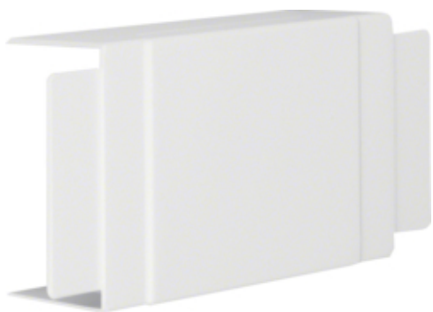
Derivat T LF 60110, RAL9010